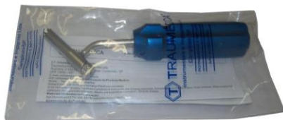
Embalagens Plástica (polietileno)